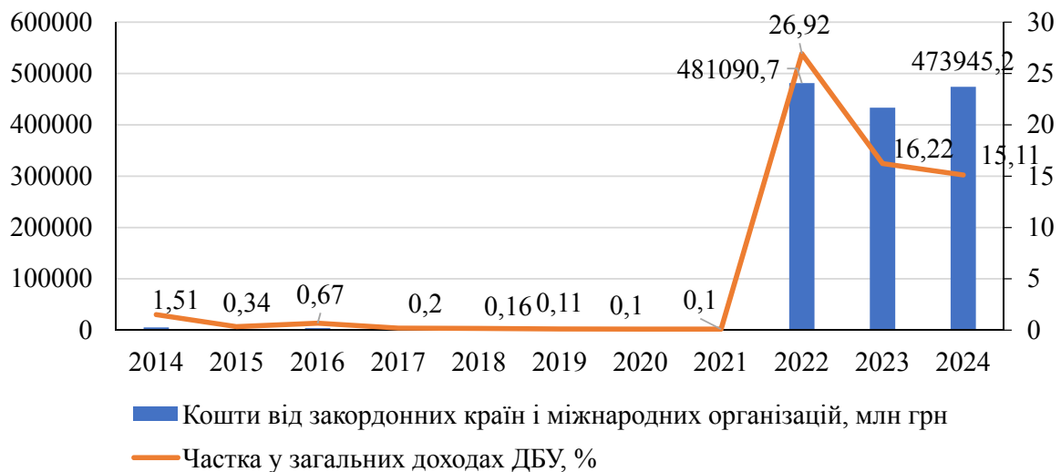
Рисунок 1 – Динаміка коштів, які надійшли від закордонних країн та міжнародних організацій до Державного бюджету України у вигляді грантів у 2014–2024 роках