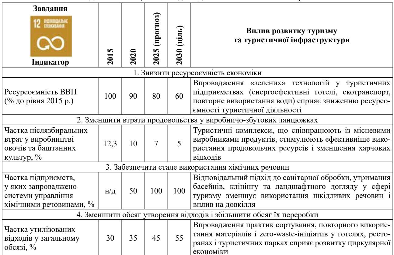
Таблиця 3 – Вплив розвитку туризму та туристичної інфраструктури на досягнення ЦСР 12 «Відповідальне споживання» в Україні