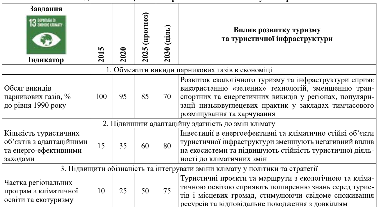
Таблиця 4 – Вплив розвитку туризму та туристичної інфраструктури на досягнення ЦСР 13 «Боротьба зі зміною клімату» в Україні