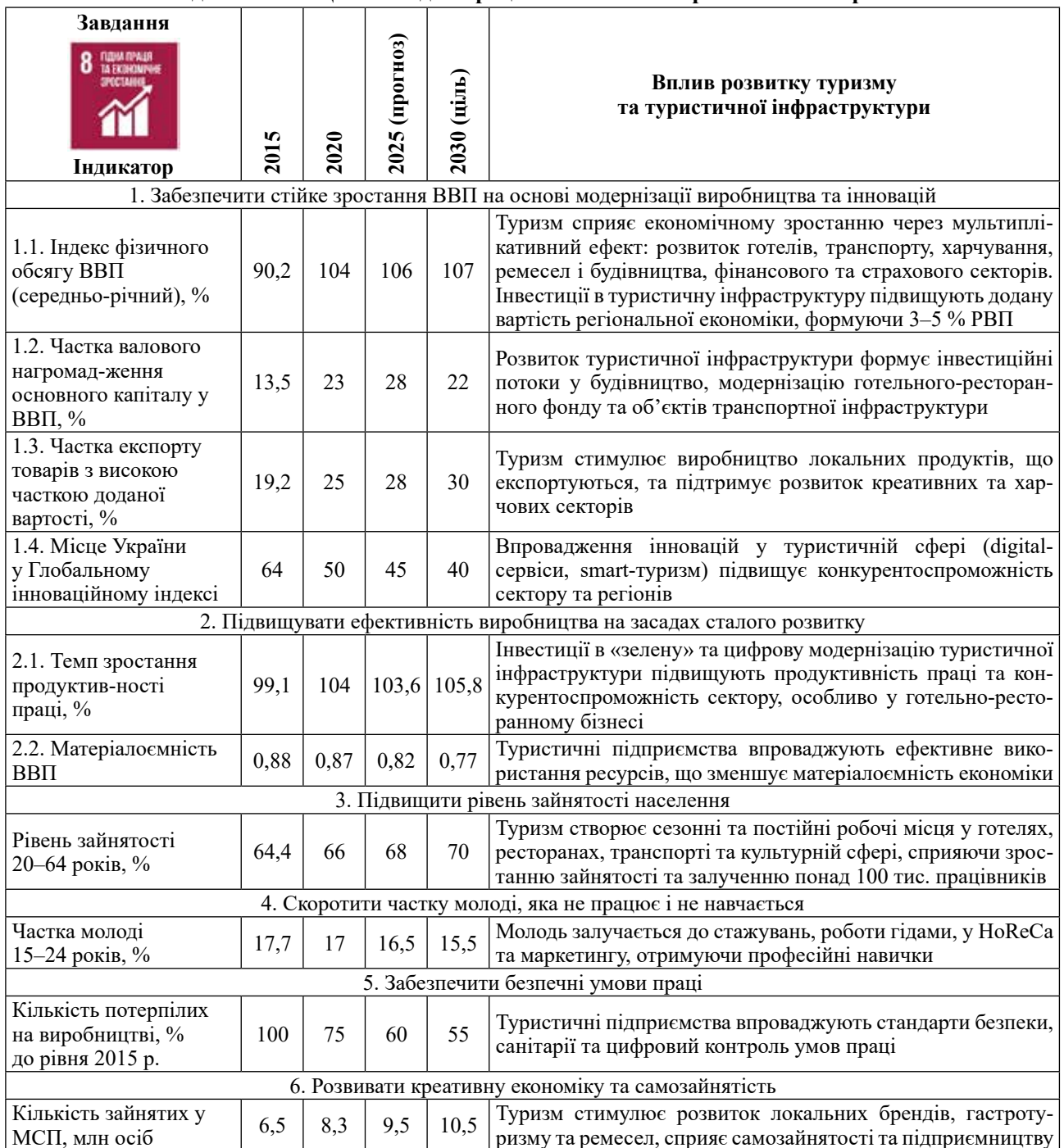
Таблиця 1 – Вплив розвитку туризму та туристичної інфраструктури на досягнення ЦСР 8 «Гідна праця та економічне зростання» в Україні

Джерело: складено автором на основі [11]